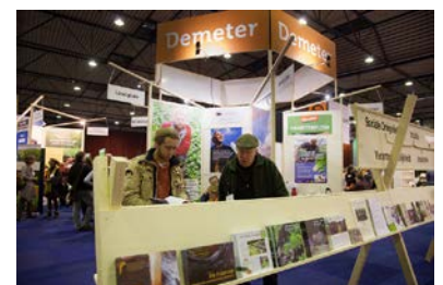
Demeter-plein met Warmonderhof, BD-Vereniging, Kraaybeekerhof, Landgilde, stg. BD-Grondbeheer

We ontvingen veel positieve reacties op ons Demeter-plein waar bezoekers ook werden uitgedaagd mee te denken over toekomstbestendige landbouw