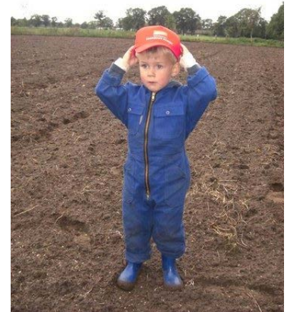
Toekomst Zaaien op de Beukenhof 2012