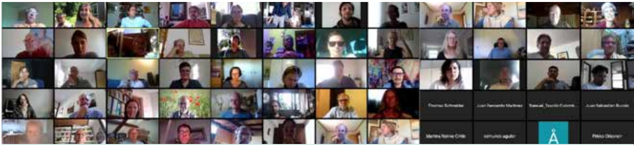
Online vergaderen tijdens de Members Assembly